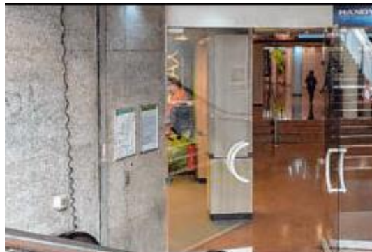
Das gleiche Bild im Jahr 2019: Bald soll es neue Konzepte für den Tunnel geben.