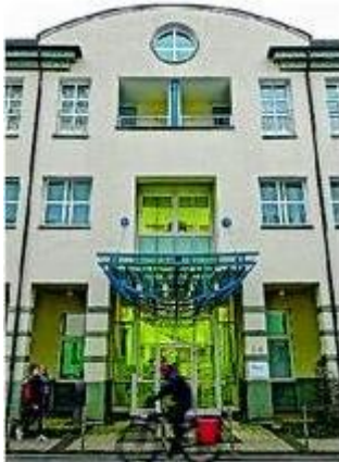
Die LZB: Heute sitzt sie an der Kavalleriestraße.

An der Herforder Straße - diagonal gegenüber der früheren alten Hauptpost - befand sich lange Jahrzehnte die örtliche Niederlassung der Landeszentralbank, "LZB" genannt. In den Zeiten als es noch keine Girokonten gab, spielte sie in der städtischen Wirtschaft eine ganz besondere Rolle: Jede Woche kamen zahlreiche Lohnbuchhalter dorthin und holten mit Aktentaschen große Mengen von Bargeld ab. Dann verfertigten sie die Lohntüten für die Arbeiter und Beschäftigten. Zum Wochenende wurde der Verdienst dann ausgegeben. Die LZB erhielt ihre Geldlieferungen zumeist mit schweren Sattelschleppern, die mit Werbeaufschriften, wie zum Beispiel von Haribo, versehen waren, um unverdächtig zu sein. Erst direkt an der Niederlassung sprang dann ein gutes Dutzend Polizisten mit Maschinenpistolen aus ihren Autos und sicherten die Entladung.