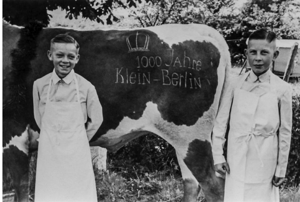
Dieses historische Foto entstand 1939 anlässlich der 1000-Jahrfeier in Schildesche. Neben einer preußischen Königskrone hatte man auf einer Kuhhaut den Begriff Klein-Berlin einrasiert.

Grundhaltung, die damit öffentlich dokumentiert wurde, sprach der Volksmund dabei von der Halleluja-Zwiebel, der Glaubens-Zwiebel oder auch Bethel-Zwiebel.