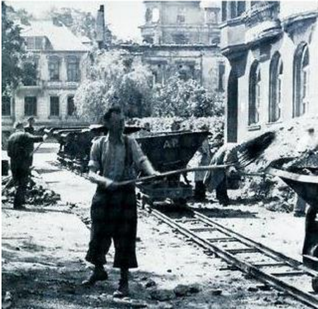
Engagiert: Auch der damalige SPD-Oberbürgermeister Artur Ladebeck half mit, die Trümmer während der Nachkriegszeit zu beseitigen.

Für die SPD begann damit eine Zeit der Verfolgung und Inhaftierung. Nach dem totalen Zusammenbruch des "Tausendjährigen Reiches" im Jahre 1945 waren die SPD-Genossen zur Stelle und gründeten am 26. Oktober die Bielefelder SPD in der Oetkerhalle neu. Zentrale Persönlichkeit wurde Artur Ladebeck (1891 bis 1963), der von 1946 bis 1961 - mit einer kurzen Unterbrechung - als Oberbürgermeister amtierte. Er war sich nicht zu schade, auch beim Trümmerschippen mit anzufassen. Unter seinem Nach-Nachfolger Herbert Hinnendahl (1914-1993) wurde die Stadt Bielefeld beständig weiterentwickelt. Markante Ereignisse waren dabei der Bau der Universität Ende der 1960er Jahre und der Ausbau des Stadtbahnsystems. Ein weiterer Sozialdemokrat, Emil Groß (1904 bis 1967), war in dieser Zeit ebenfalls ein markanter Vertreter seiner Partei. Er hatte 1946 die Tageszeitung "Freie Presse" begründet und war lange Zeit deren Herausgeber. Ebenso vertrat er von 1946 bis 1967 Bielefeld im nordrhein-westfälischen Landtag.