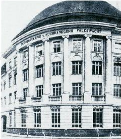
Buchhandlung: Ab Sommer 1890 bis 1933 war die Tageszeitung "Die Volkswacht" das Sprachrohr der Bielefelder SPD. Gedruckt wurde sie an der Arndtstraße.