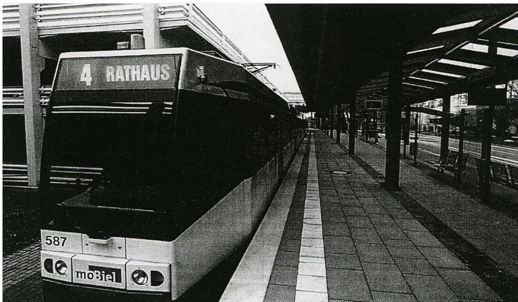
Mit der Linie 4 Richtung Rathaus